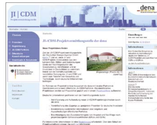
Homepage der JI-/CDM-Projektvermittlungsstelle der dena.